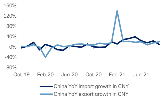
Gráfico 2: Comercio exterior en China

5 de noviembre de 2021