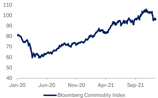
Gráfico 1: Índice Bloomberg de materias primas

Fuente: Bloomberg Finance L.P., Deutsche Bank AG. 17 de diciembre de 2021