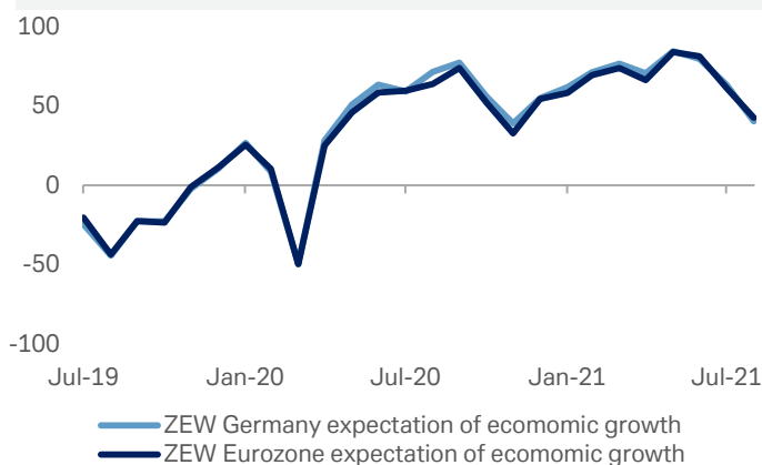
Gráfico 1: Expectativas de crecimiento económico del ZEW alemán

Fuente: Bloomberg Finance L.P., Deutsche Bank AG. 13 de agosto de 2021.