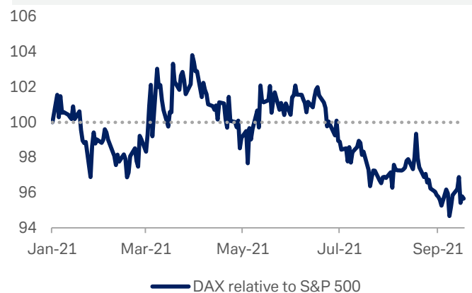
Gráfico 2: DAX frente al S&P 500