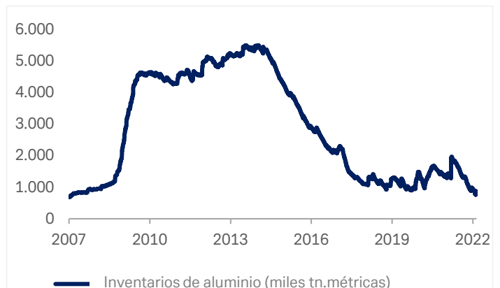
Gráfico 2: Cotización de las reservas de aluminio en la Bolsa de Metales de Londres

Fuente: Bloomberg Finance L.P., Deutsche Bank AG. 18 de febrero 2022