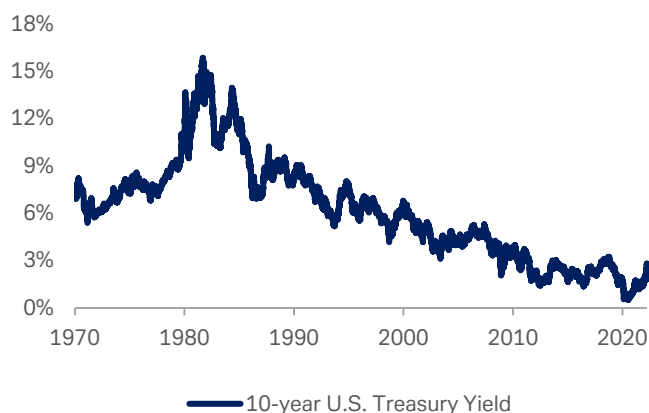
Gráfico 2: Rentabilidad de los Treasuries de EEUU a 10 años

Fuente: Bloomberg Finance L.P., Deutsche Bank AG. 15 de abril de 2022